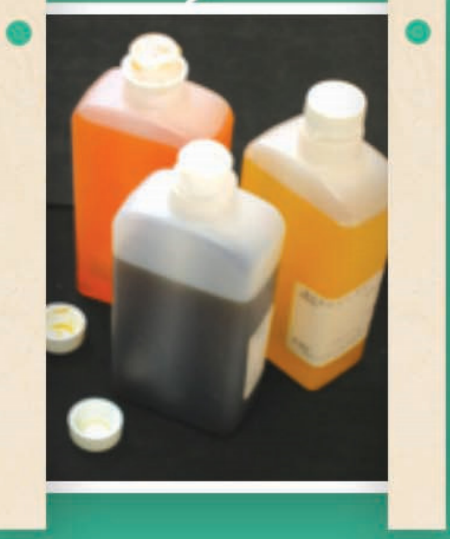
咳藥水(飲B、囉囉擊、黃豆仔)