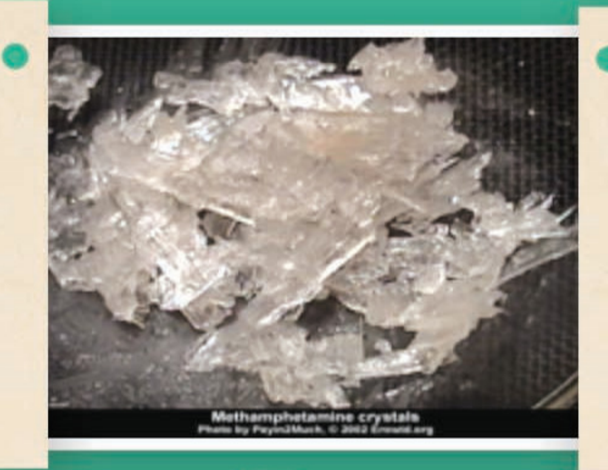
甲基安非他命(冰、豬肉)